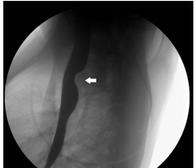
Şekil 4. Baryumyu özofagus grafisinde; orta kesimde aortik ark seviyesinde, retroözofageal seyirli sol subklavian arterin oluşturduğu posteriorda dıştan basıya ait indentasyon ( sola bakan ok ) ve hafif sola açılanma mevcuttur.

Aortik ark ve onun major dallarının gelişimsel anomalileri otopsilerin yaklaşık olarak %3'ünü oluşturur, rölaf olarak yaygın olmasına rağmen çoğunluğu genellikle