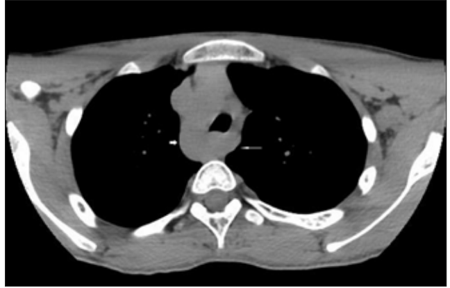
Şekil 1. Aksiyel BT incelemesinde; Sağ aortik ark anomalisi ( kısık kalın ok ), Sol subklavyen arter inen aorttan anormal çıkış göstererek retroözofajial seyir göstermektedir ( ince uzun ok ).

Bu hastalar genellikle asemptomatiktir ve anomaliler başka nedenlerle yapılan incelemelerde tesadüfi olarak saptanır. Bununla birlikte, komşu yapılara bası yapan aberran subklavyen artere ikincil olarak semptomlar gelişebilir. Biz burada sağ aortik ark anomalisi ve aberran sol subklavyen arterle ilişkili yutma güçlüğü olan 15 yaşındaki nadir bir vakayı sunuyoruz.