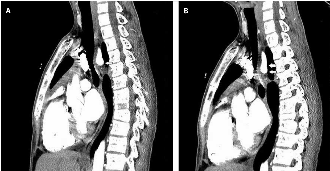
Şekil 2 A,B. Sagittal BT anjiyografi incelemesinde; Sağ aortik ark anomalisi, Sol subklavyen arter inen aorttan anormal çıkış göstererek retroözofajial seyir göstermekte olup çıkımı seviyesinden özofagus trakea ile arkus aorta-subklavyen arter çikim arasında dar bir alanda izlenmektedir ( beyaz dolgulu oklar ).

Bir yıldır yutma güçlüğü yakınması olan hastaya ilk başvurduğu merkezde gastroözofageal reflü düşünülüp reflü sintigrafisi çekilmiş, anormallik saptanmamış ve hastaya herhangi bir tedavi verilmemiş. Daha sonra ara ara yutma güçlüğü yakınmaları olan hastaya başvurduğu başka bir merkezde 3 ay boyunca proton pompa inhibitörü (PPI) ilaç tedavisi verilmiş, ilaç kullandığı dönemde yutma yakınmalarının azaldığı görülmüş. Ancak son 3 aydır ilaç kullanmayan hastanın özellikle katı gıdalara karşı yutma güçlüğü artmış. Bunun üzerine hasta hastanemiz çocuk kardiyoloji polikliniğine başvurdu, orada yapılan ekokardiyografisinde sağ aortik ark dışında anormallik saptanmadı ve yutma güçlüğü açısından vasküler ring